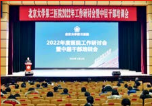
2022年工作研讨会暨中层干部培训会现场