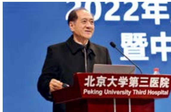
1月22日，全国政协原副主席韩启德参加我院2022年工作研讨会暨中层干部培训会并发表讲话。

北京大学第三医院 主办 2022年1月27日（本期四版） 第3期（总第537期）