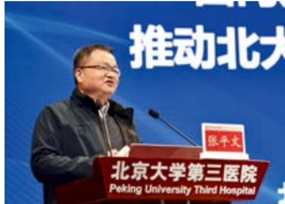
中国科学院院士、北京大学副校长张平文作报告

入阐述了推动公立医院高质量发展的背景和核心要义，介绍了高质量发展试点医院的建设目标和任务要求。通过“三个转变”，实现“三个提高”、“三个化”、“五个新”。提高效率；提高质量；提高待遇，推动医院发展“人性化、功能化、智能化”。构建新体系，构建完善的分级诊疗制度，建立有序就医和诊疗新格局，推动学科创新发展、技术、服务模式创新，对核心资源科学配置，精细管理、有效利用，提升医教研等核心业务供给质量和效率，激活新动力，建设新文化。高质量发展试点医院应加强党的全面领导，建设高水平的临床学科，开展前沿科技创新，打造高质量的人才队伍，实现科学化精细化管理，提供一流的医疗服务。